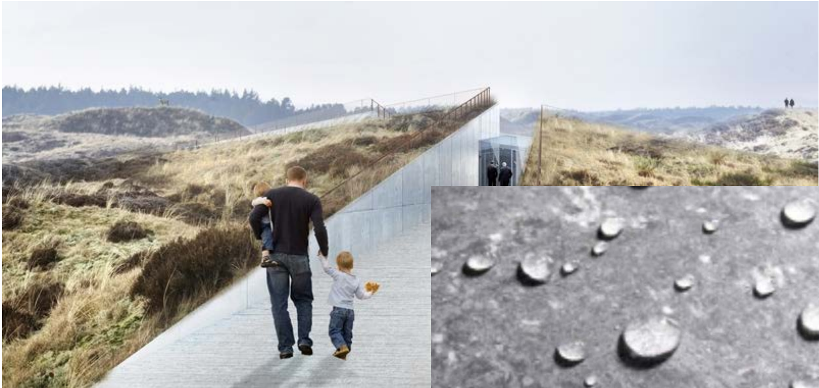
Tirpitz museum Varde