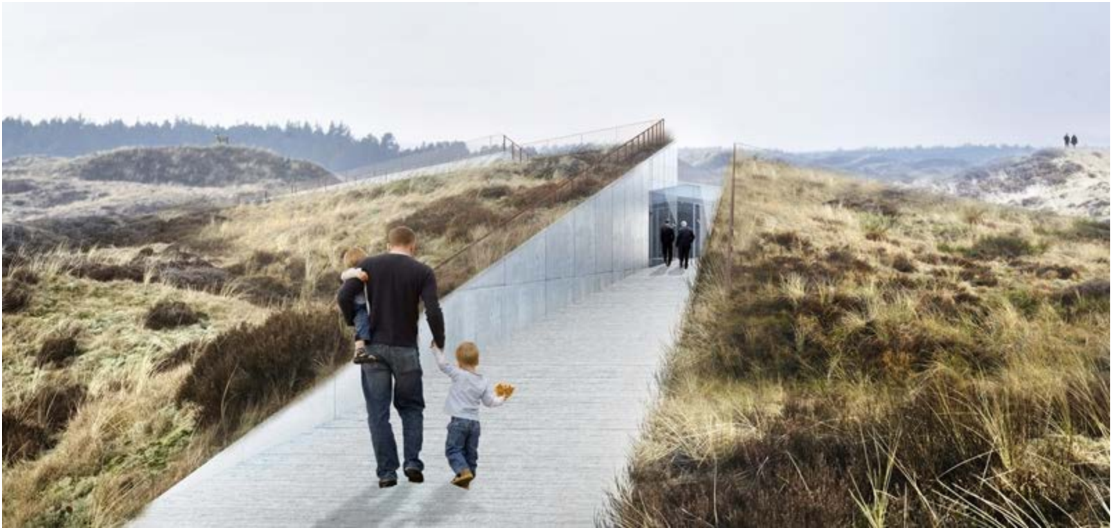
Tirpitz museum Varde